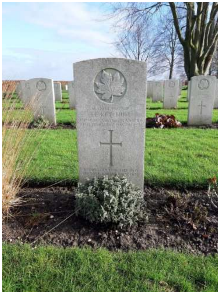
19 februari 2020

* Heeft u een foto van deze soldaat of aanvullende informatie neem dan contact op met info@facestograves.nl